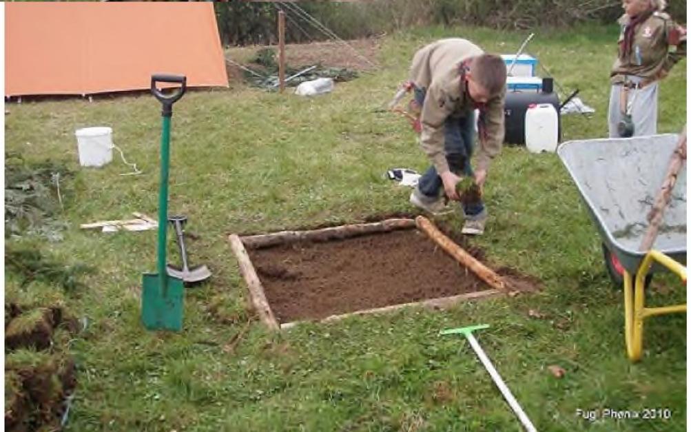
Fugl Phoenix 2010