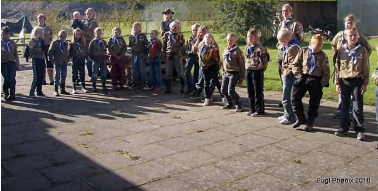
Fugl Phønix 2010