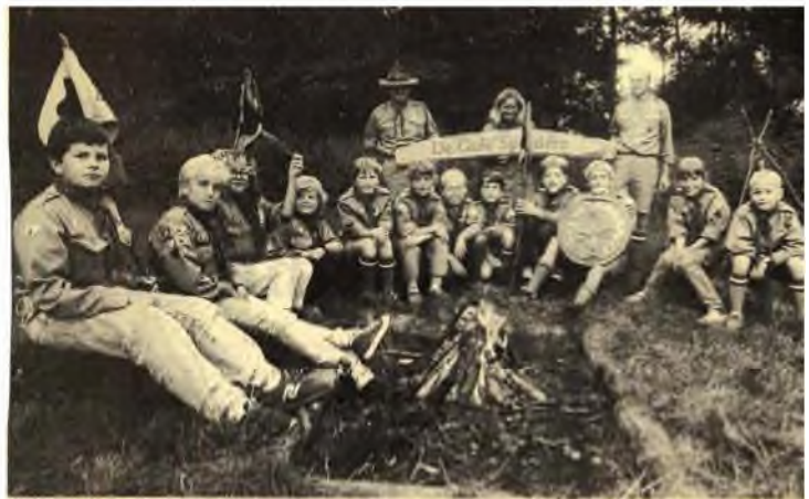
Det blev til to 1. præmier ved en mini-løb i søndags, da tre ulve-bander fra De Gule Spejdere i Sorø deltog sammen med 13 andre «fremmede» bander. Resultatet blev fejret ved et stort fællesmåltid i spejderhytten på Apote kærvej i aften.

om en mor der først måtte køre hjem efter bestik til sin spejder, så efter en kop og sidste gang efter en pude...Jo, det var en rigtig mor.. (Der nævnes ikke navne...)