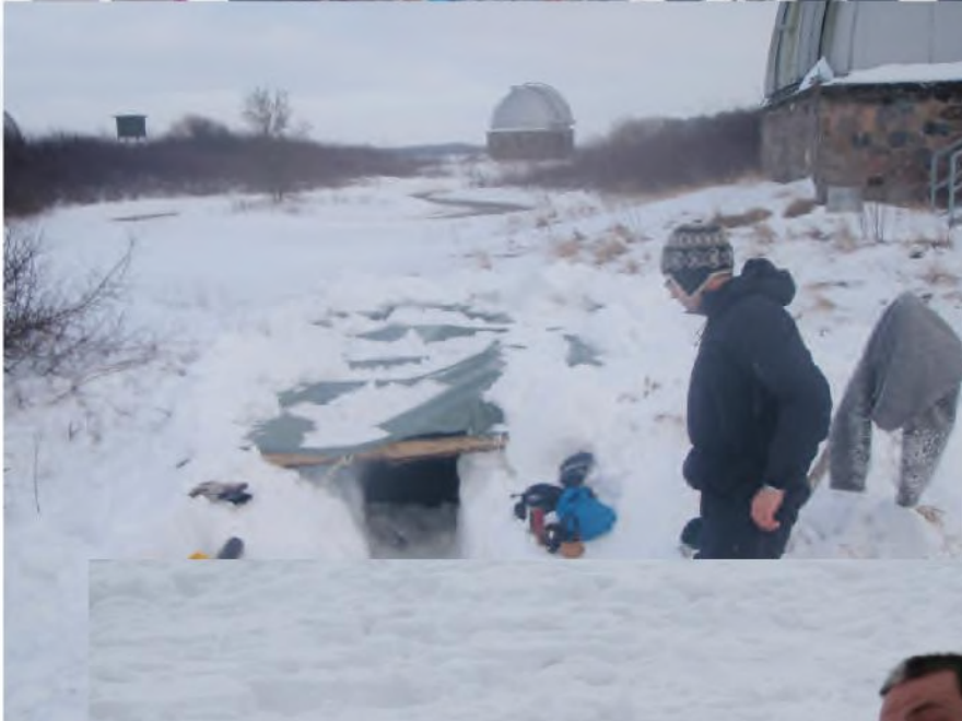
Fugl Phønix 2010