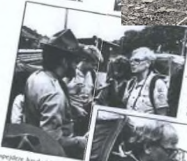
Her er det meste af modtagelseskomiteen og de amerikanske gæster fra Virginia samlet på Sorø Station.

Men i løbet af de to uger, de 11 amerikanere er her, bliver der også tid til meget andet. Vokningsture og diskussioner i Roulade, Gyldestenløse, København, Strandhøj etc.