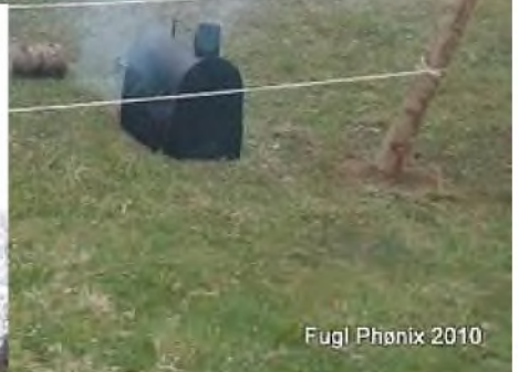
Fugl Phoenix 2010