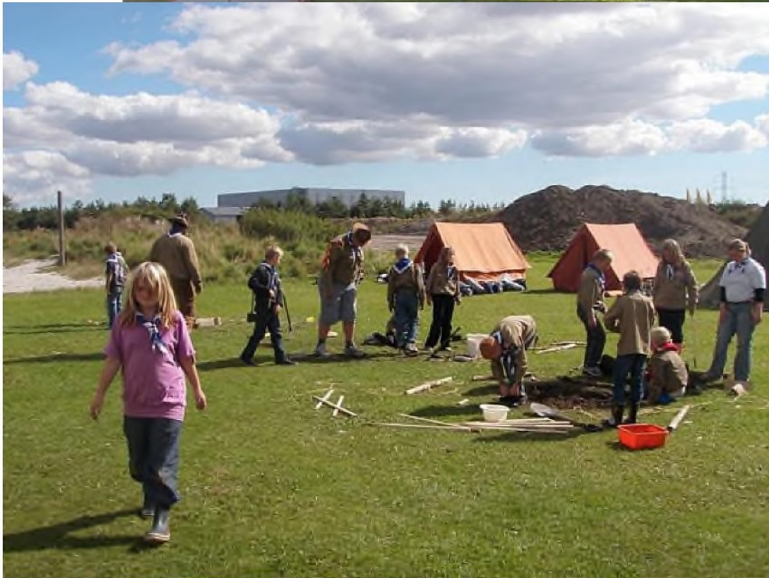
Fugl Phønix 2010