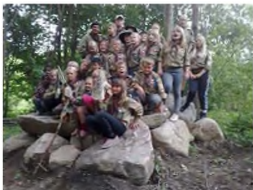
Ulve med deres nye rådsklippe - 2010

Troppen har også en stand på Barda Rollespilstræf på Parnasgrunden. Her sælges laks stegt på planke ved bål og andet godt, til de sultne middelalderfolk. En hyggelig weekend, hvor der ofte er solgt ud inden arrangementet er slut. I jubilæums året blev det til en indtægt på intet mindre end 18.700 kr.