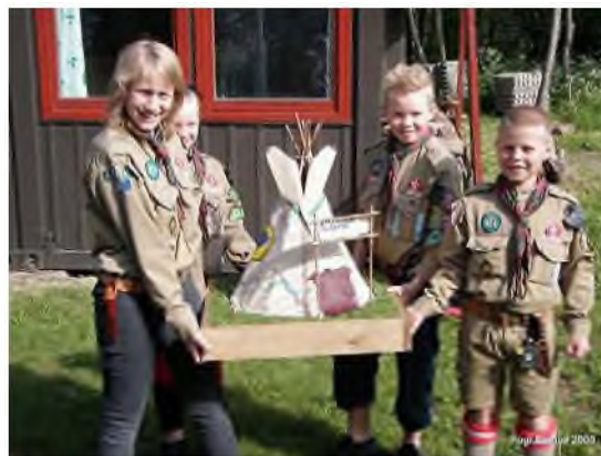
Stifindere klar til stifinderturering 2009

Spejdere har selvfølgelig også hemmelige ritualer – men de er jo ikke hemmelige mere hvis de står her!